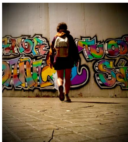
Art de rue