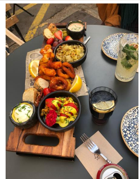
Tapas de Barcelone