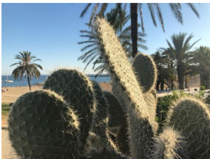
Nature, plage, mer

Comme mentionné auparavant, l'expérience ne s'arrête pas au lieu de travail mais elle va bien plus au-delà. En faisant ce pas vers ce nouveau projet, des changements sont nombreux tels que : des rencontres avec des personnes du monde entier, des nouvelles amitiés, des découvertes culinaires, un apprentissage dans le partage avec des personnes d'environnements différents, des concerts, des musées, un autre paysage qu'en Suisse, un apprentissage d'une langue voire d'un dialecte, des quiproquos, des questions, des réponses, des nouvelles habitudes, de nouveaux moyens de transports, et bien d'autres.